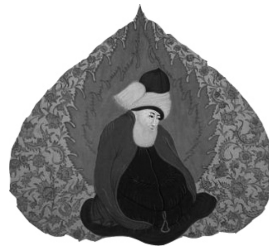
Maulana Jalal al-Din Rumi